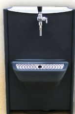
Tireuses à Bières